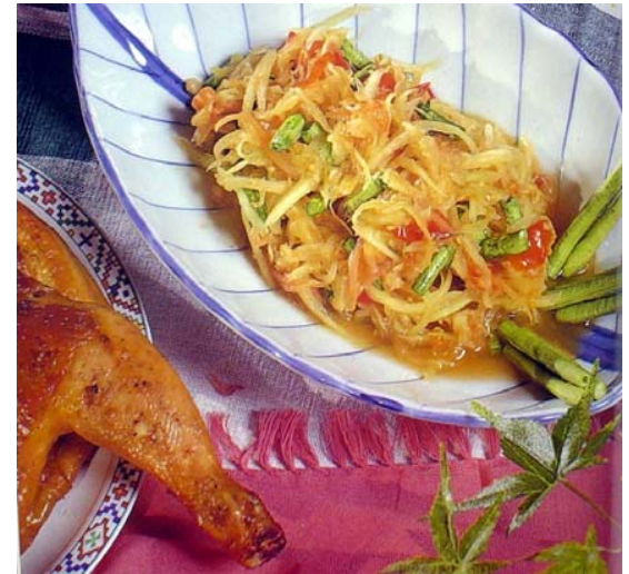
ส้มตำไก่ย่าง